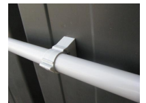
Rapid-Tub - vue en situation